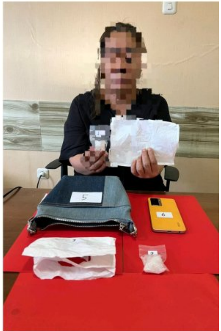
Tampak 2 wanita di tangkap Satreskoba Polres Morowali