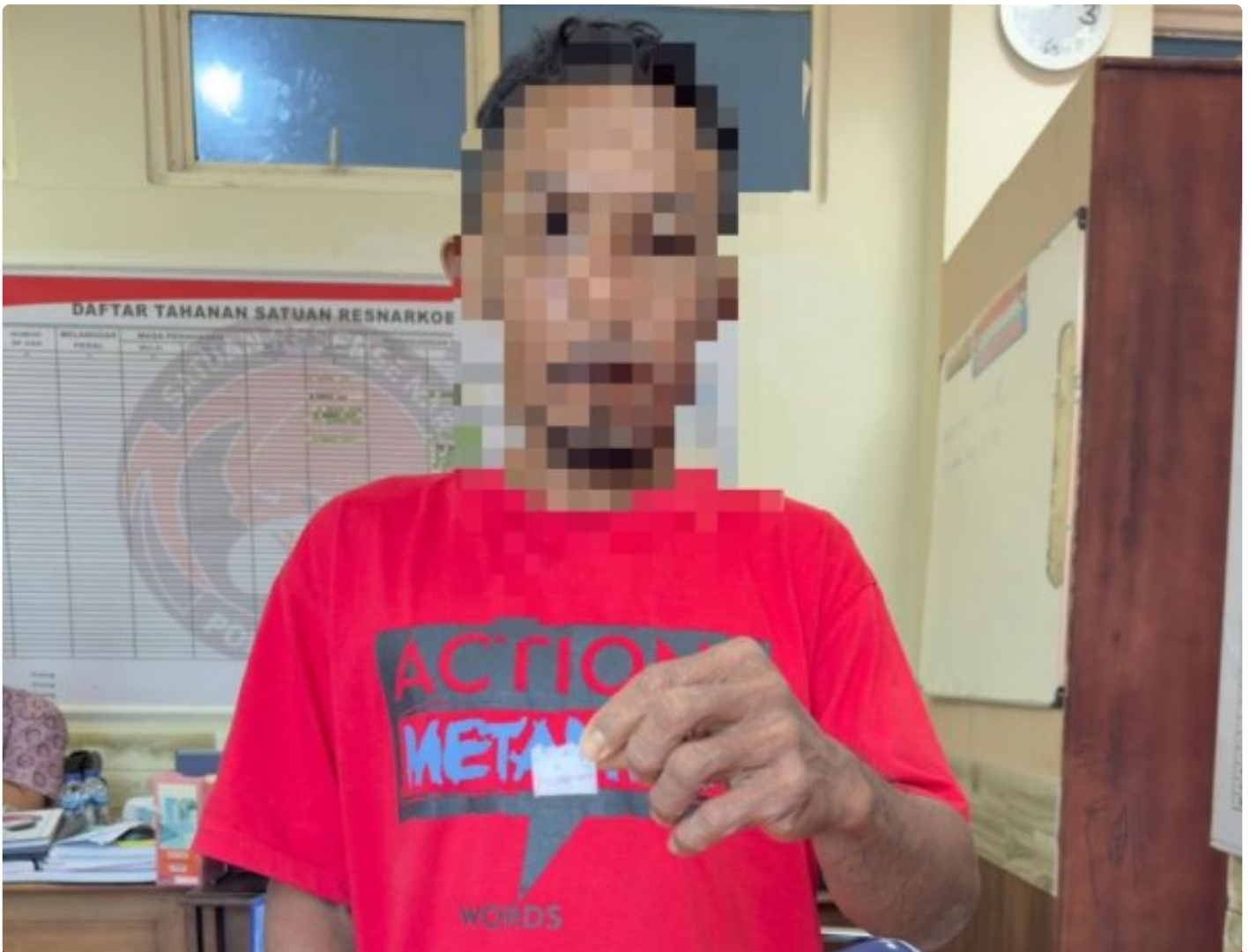
Pelaku Penyalahgunaan Narkotika jenis sabu diringkus dari Desa Lele